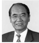
「明日の京都 文化遺産プラットフォーム」会長 (前ユネスコ事務局長) 松浦 晃一郎

京都には、「古都京都の文化財」(世界遺産)をはじめとする数多くの有形の文化遺産があります。同時に、祇園祭等の伝統的な祭礼行事や茶道、華道、京舞等の伝統文化・芸能など、長い時間をかけて世代から世代へと受け継がれてきた無形の文化遺産も数多くあります。そして、それら有形、無形の文化遺産は、京都の人々の生活習慣に溶け込むように存在しており、京都という文化空間を形成しています。