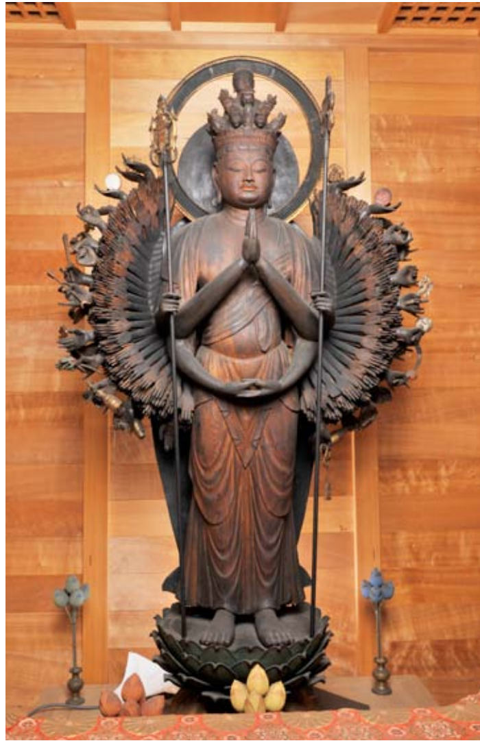
京都府京田辺市 寿宝寺 重文 千手観音立像