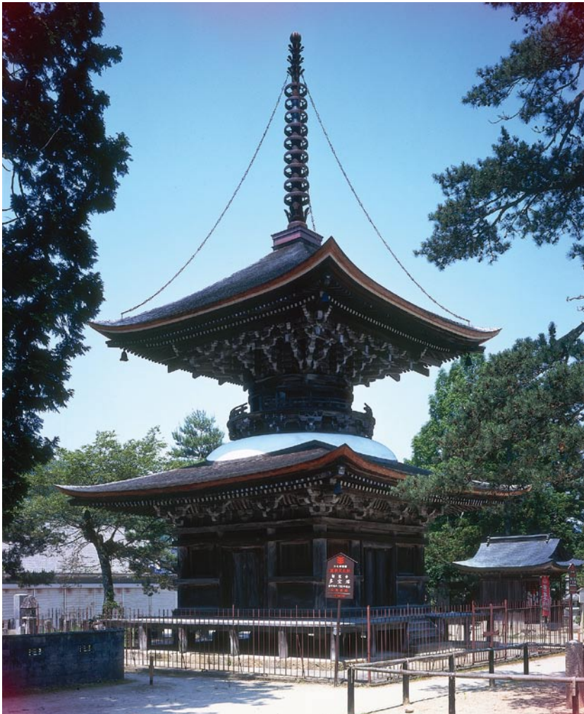
京都府宮津市 智恩寺 重文 多宝塔