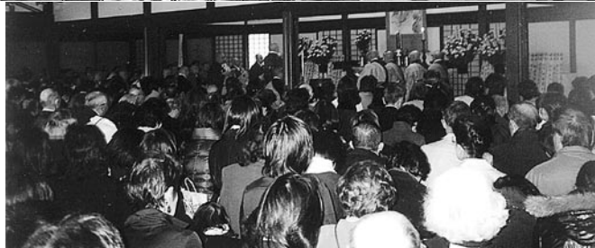
中央葬祭業協同組合共 催による恒例の春季焼 骨灰供養法要が、満堂 参拝の中厳修された。

臨済宗相国寺派佐分宗順教学部長の法話に続き、臨済宗相国寺派管長有馬頼底猥下導師のもと山内ご出仕により彼岸供養法要が厳修された。約千五百人もの参拝者を迎え、大方丈に溢れるほどの列は庭まで長く続き、この半年間にお亡くなりになられた故人をしのぶ焼香の列は後を絶たなかった。