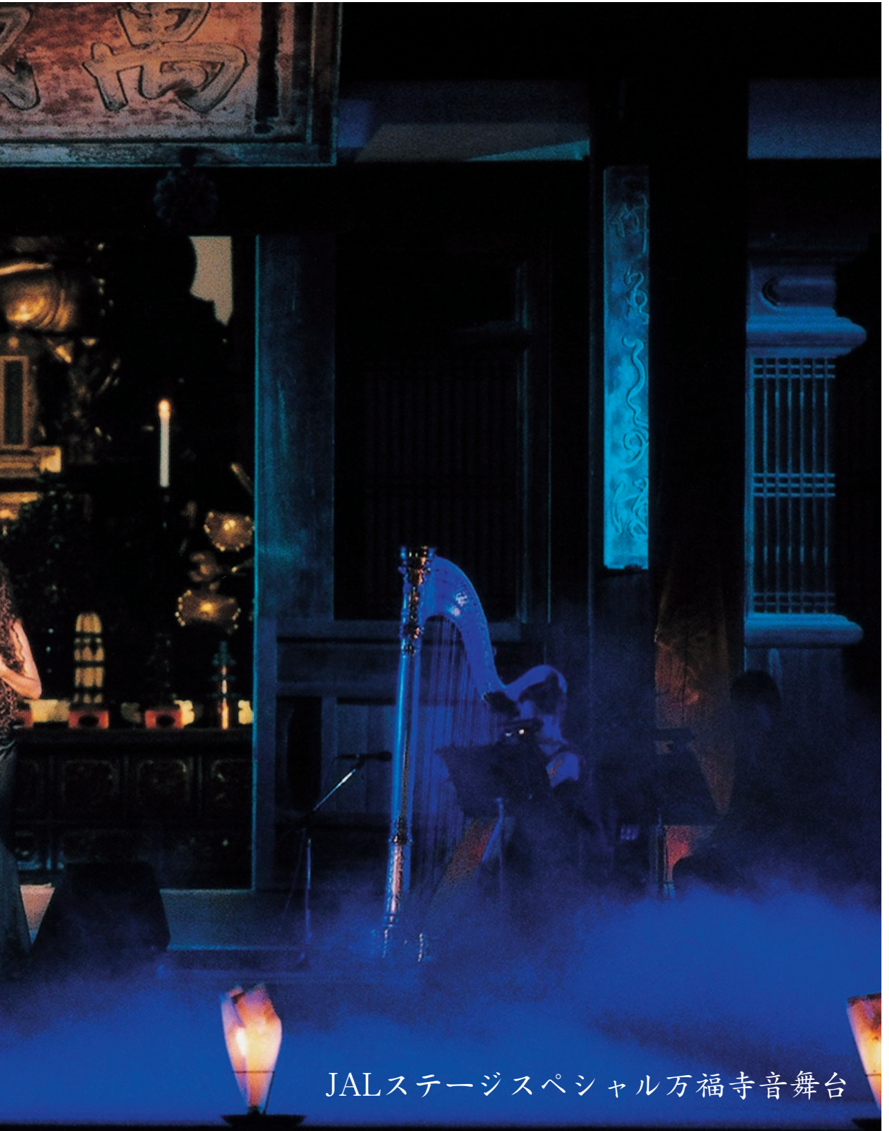
JALステージスペシャル万福寺音舞台