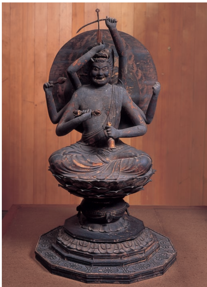
京都府相楽郡 神童寺 重文 愛染明王